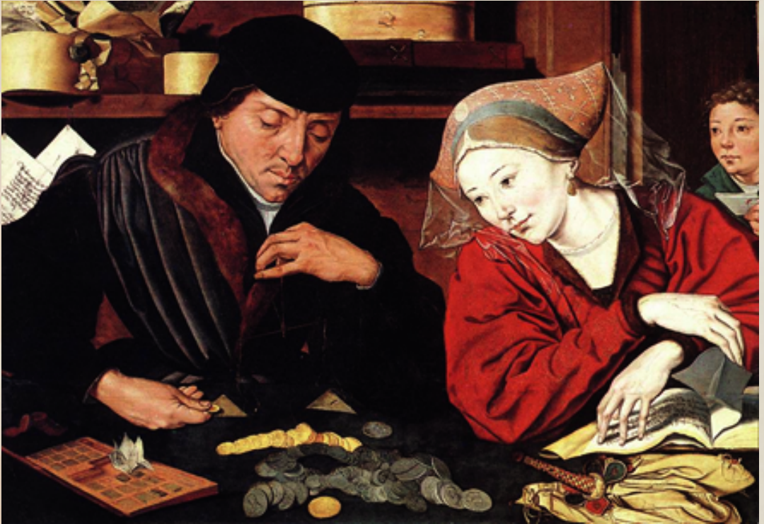
M arinus van Reymerswale , Le changeur et sa femme (1er moitié du XVIe siècle). Musée des Beaux -Arts de Valenciennes

S'EST EXPRIMÉE PAR LA PEINTURE DE GRANDS ARTISTES