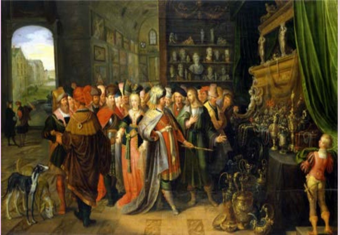
Frans FRANCKEN le Jeune (1581-1642) Crésus montrant ses trésors à Solon. Musée Calvet, France

S'EST EXPRIMÉE PAR LA PEINTURE DE GRANDS ARTISTES