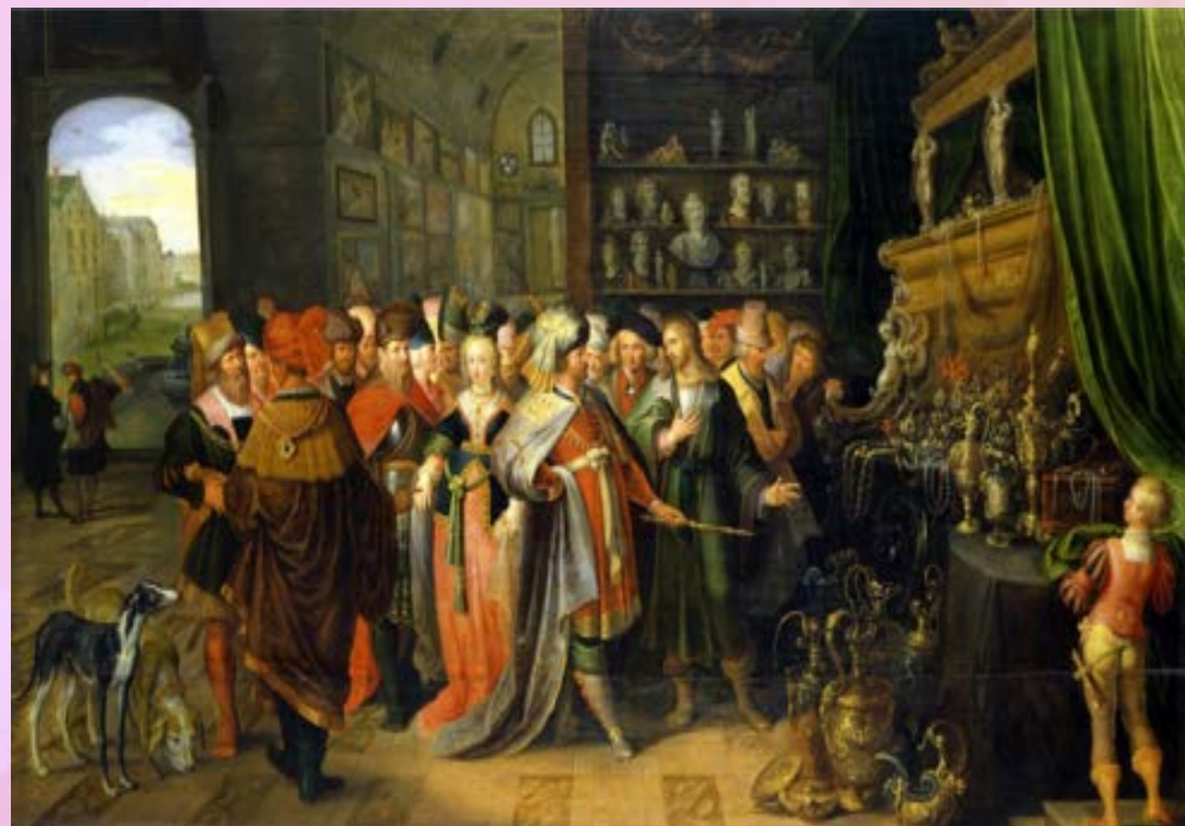
Frans FRANCKEN le Jeune (1581-1642) Crésus montrant ses trésors à Solon. Musée Calvet, France

Sur ce tableau (1620 - 1630), Crésus, roi de Lydie au VI e siècle avant Jésus-Christ, montre ses richesses à ses invités et essaye d'impressionner Solon, le célèbre législateur athénien.