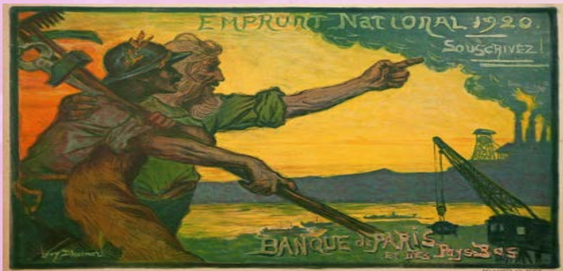
« Emprunt National 1920 », Lévy-Dhurmer TIRÉE DE LA COLLECTION DE LA MAISON DE L'ÉPARGNE