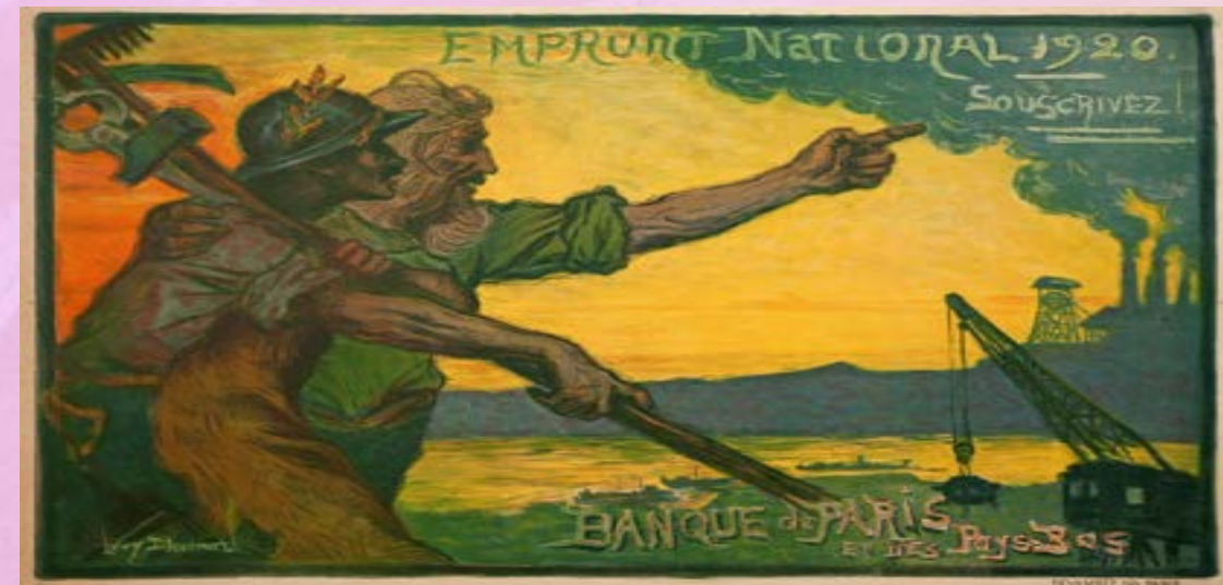
« Emprunt National 1920 », Lévy-Dhurmer